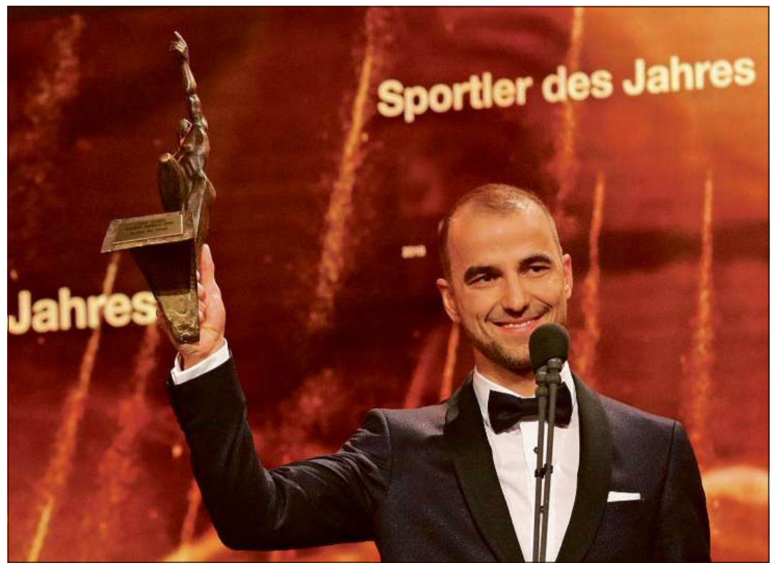
Nino Schurter ei il «Sportist svizzer digl onn 2018». Ina tiarza dils votants ha dau ad el la vusch.

■ Diesch ga ei il mountainbiker Nino Schurter staus candidat per il «sportist digl onn». Alla dieschavla ga ha el retschert ina tiarza dallas vuschs e gudignau la dumengia sera avon Roger Federer e Dario Cologna. Il mountainbiker da Tersnaus ei suenter Heini Hemmi il 1976 e Dario Cologna il 2013 il tierz sportist grischun che porta il tetel da «sportist svizzer digl onn» ed igl empren sportist da stad. En sia carriera da sport ha igl um da 32 onns carschius si a Tersnaus en Lumnezia gudignau tut quei ch'ins sa gudignar el sport da mountainbike. Suenter l'elecziun a «sportist digl onn 2018» ha Nino Schurter era constatau: «Ussa hai jeu gudignau tut.» Mo era sch'el ha gudignau tut fa il bab d'ina feglia da treis onns sesents a Cuera negins patratgs da terminar sia carriera. En quella carriera ha el gudignau siat tetels da campiun mundial dall'elita e sis ga il classament general dil Cup mundial. Vitier vegn igl entret da medaglias gudignadas a treis Giugs olimpics. Sportista digl onn ei per la secunda ga la triatleta Da-