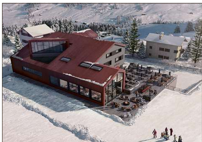
Sco in bloc erratic schai il niev hotel Pellas agl ur dil vitg da Vella, gest sper la pista.